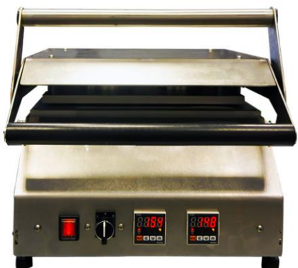
On Seal Manual

Επιτραπέζιες Θερμοσυγκολλητικές Μηχανές με Περιμετρική Κοπή Φιλμ