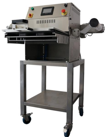
On Seal Semi-Auto Rotary

Ημιαυτόματες Κλειστικές Μηχανές με Περιστρεφόμενη Τράπεζα και Περιμετρική Κοπή Φιλμ